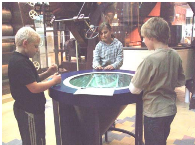
Leerlingen op bezoek in het Verkadepaviljoen