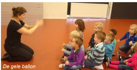
De gele ballon