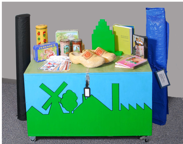
De projectkist Zaans Erfgoed

Het plan om deze kisten te ontwikkelen kwam op, toen een aantal scholen in de Zaanstreek een schoolbreed project rond erfgoed deden. Alle scholen kozen voor hun groepen een project uit het erfgoedmenu en waren daarnaast binnen school ook zoveel mogelijk met erfgoed bezig.