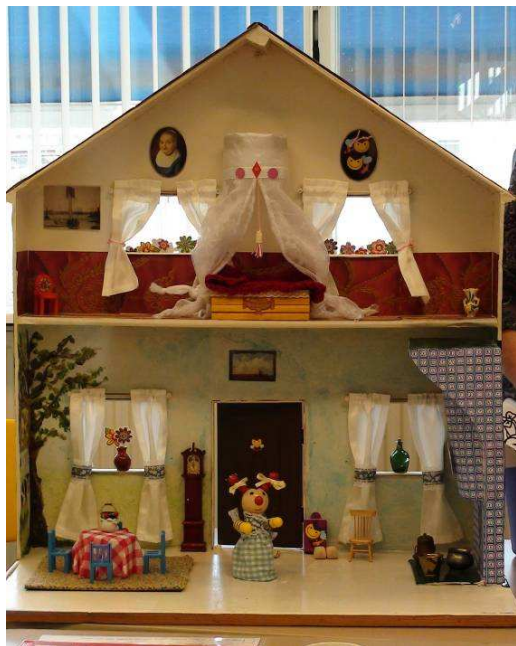
Het huis van Trijntje Bij