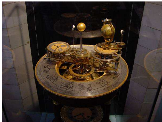
Uurwerk met planetarium en sterrenbeelden

meiden wordt vooral getrokken als het toverwoord sterrenbeelden valt. Al zijn er maar weinigen die weten wat sterrenbeelden nu eigenlijk zijn: twaalf verschillende groepen sterren, die tijdens een bepaalde maand van het jaar aan de hemel te zien zijn.